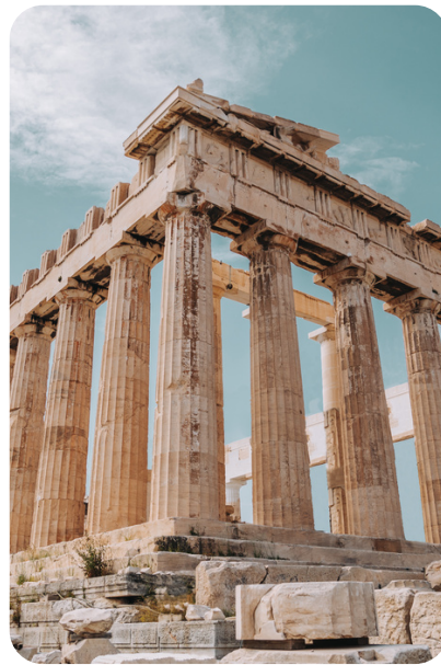
Catedral de Atenas