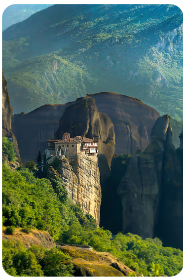
Montasterios de Meteora