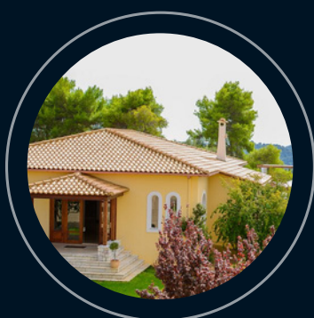
Olympia Olympion Asty o similar