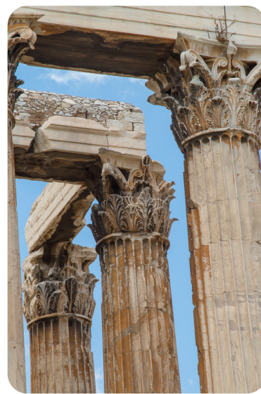
Templo Dórico de Zeus