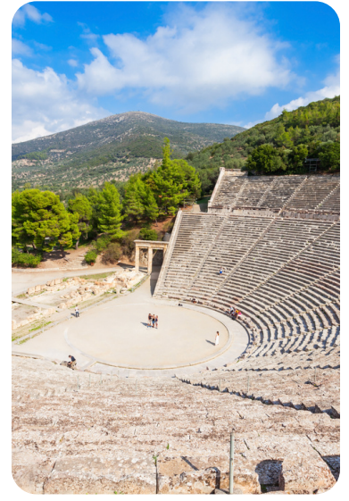
Ciudad de Epidauro