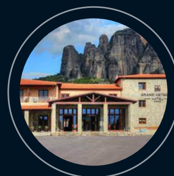
Meteora Grand Meteora o similar