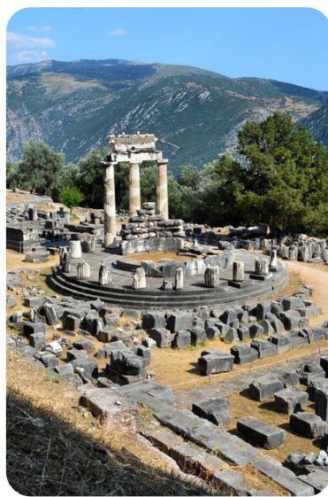
Oráculo de Delfos