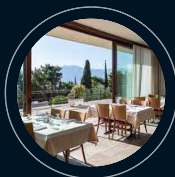
Delfos Amalia Delphi o similar