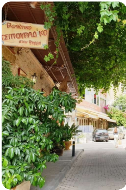
Plaka y Psiri